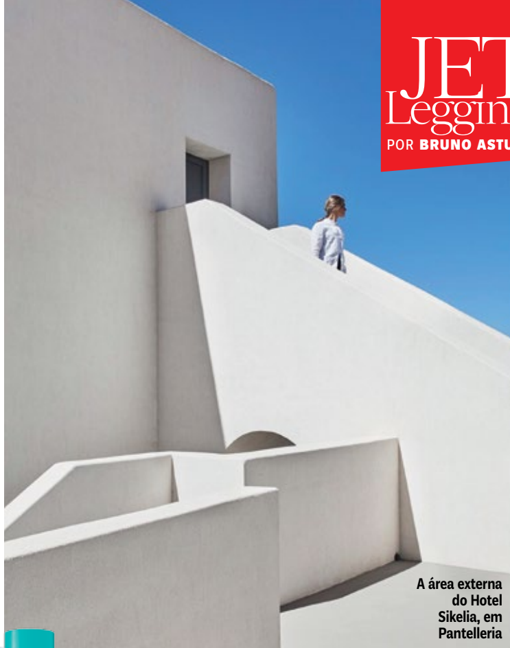
A área externa do Hotel Sikelia, em Pantelleria