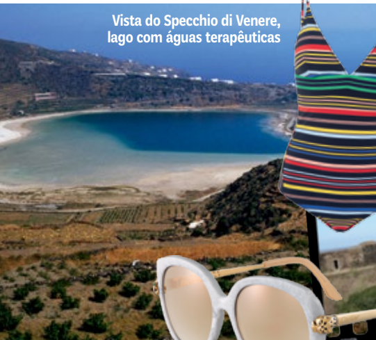
Vista do Specchio di Venere, lago com águas terapêuticas