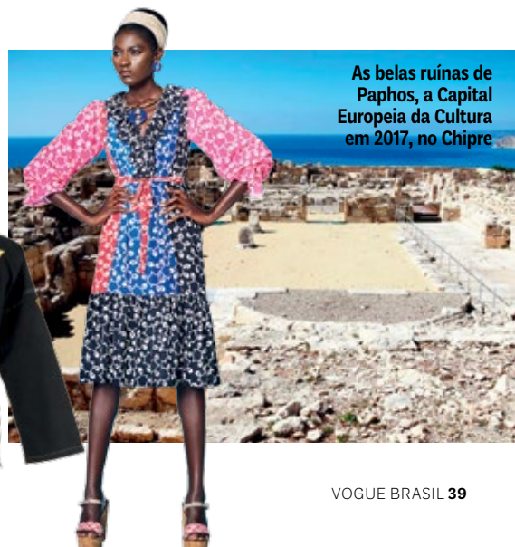
As belas ruínas de Paphos, a Capital Europeia da Cultura em 2017, no Chipre